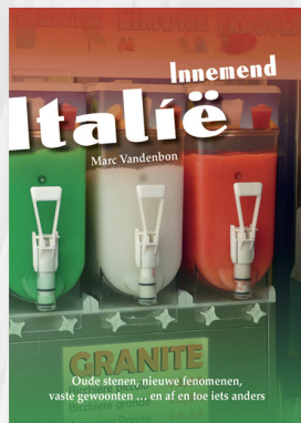
Innemend Italië, 2011