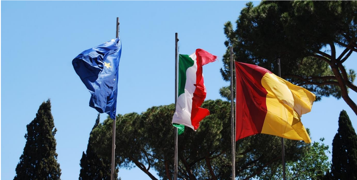
Kroniek nr: 17 van “Innemend Italië” op 737 ex. Mijmeringen, bedenkingen, mededelingen, schrijfsels...