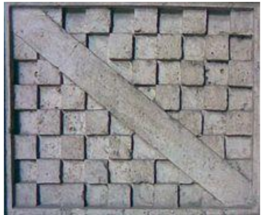
Wapenschild familie Mattei

Marc Vandenbon Auteur van "Innemend Italië" marc.vandenbon@telenet.be www.innemenditalie.be