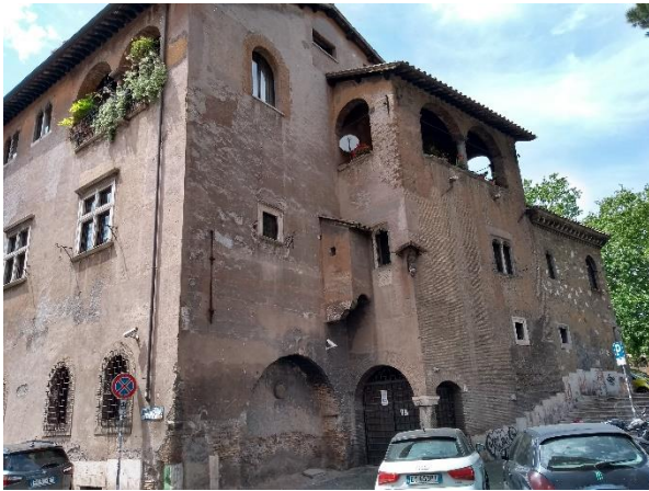
Casa Mattei (Piazza in Piscinula)

Bij een familieruzie werden in het Casa Mattei op de Piazza in Piscinula ooit vijf familieleden vermoord. Vandaag is het complex ingedeeld in meerdere wooneenheden. Onder de loggia rechts is nu zelfs een garage gebouwd. Voor ons verhaal is echter het uitspringende toilet daarboven belangrijk. Zo zijn we opnieuw beland bij dit architectonische kleinood. Dit is het enige dergelijk voorbeeld in Rome dat mij bekend is. Maar wellicht zijn er nog meer.