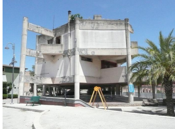
Poggioreale nu: ten prooi aan erosie

Twee weken later reden we, weliswaar met de wagen, dezelfde laatste 20 kilometers af over de SS119. Een spiksplinternieuw wegdek, zoals zo dikwijls wanneer de Giro ergens passeert. Zo vonden we de ruïnes van Poggioreale en de witte betonvlakken van Gibellina. Poggioreale ligt er nog steeds bij als een ruïne. Totaal verlaten. De toegang tot het dorp is afgesloten. Maar zonder problemen kan je via de heuvels zo het plaatsje binnenwandelen. Toch hebben we het niet gedaan. Het leek teveel op grafschennis.