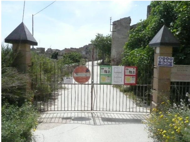
Het oorspronkelijke Poggioreale

Op 9 mei 2018 kwam de 5 de rit van de Giro d'Italia aan in Santa Ninfa. Niet omdat dit stadje een enorm bod had gedaan om als aankomstplaats te mogen fungeren. Zo rijk zijn ze daar ook weer niet, maar als eerbetoon aan de getroffen streek, 50 jaar na de aardbeving. De Italiaan Enrico Battaglin won de etappe. Terloops: Battaglin is afkomstig uit Marostica, het stadje nabij Vicenza dat wereldwijd bekendheid geniet omwille van het folkloristische levende schaakspel dat er om de twee jaar wordt opgevoerd.