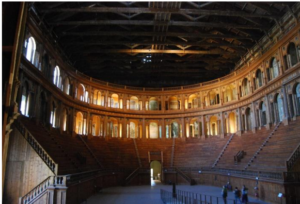
Teatro Farnese (Parma)

Zowel de constructie onder de tribunes als de ruimte achter de scène zijn een bezoek waard. Samen met het archeologisch museum en de Galleria Nazionale maakt het deel uit van het Palazzo della Pilotta, eigendom van de familie Farnese. Voor het gebouw staat een monument ter ere van Giuseppe Verdi.