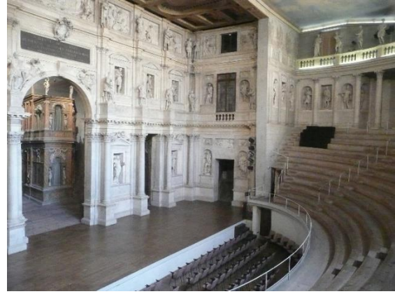
Teatro Olimpico (Vicenza)

Van enkele decennia daarvoor dateert het Teatro Olimpico in Vicenza, het laatste project van de befaamde Andrea Palladio die de realisatie ervan nooit heeft mogen aanschouwen. Het theater is voornamelijk bekend omwille van de vijf doorgangen in het decor die er reeds aangebracht zijn door Vincenzo Scamozzi ter gelegenheid van de inhuldiging in 1585. De doorgangen stellen straten voor uit het Vicenza van toen. Maar vergis u niet. We worden hier geconfronteerd met perfecte trompe-l'œils.