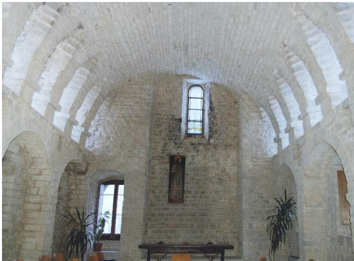
Het scriptorium in het monasterium Fonte Avellana*

Bij het betreden van het scriptorium wijst hij ons op een detail in de toegangsdeur. In een van de houten panelen werd het wapenschild van de abdij uitgesneden. De top daarvan bestaat uit een hazelaar, bekroond met een kruis. Naast nocciòllo is avellana in het Italiaans trouwens een andere naam voor de hazelaar. De Nutella-liefhebbers zullen dit kleine detail wel weten te smaken.