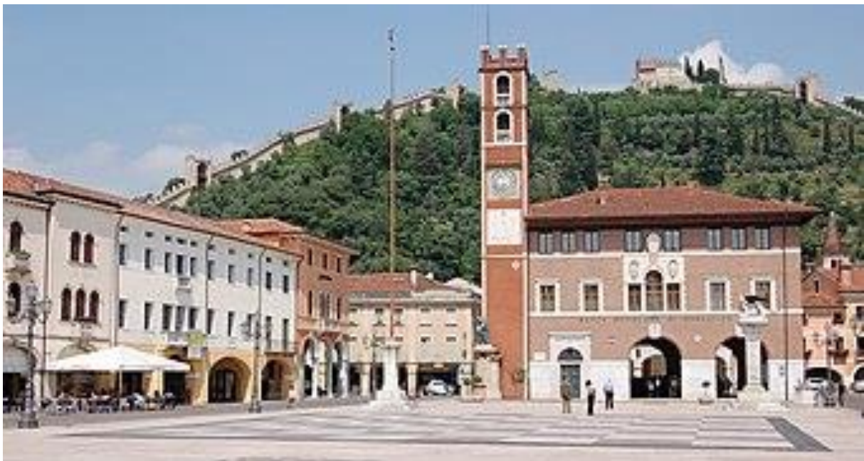
*De Piazza degli Scacchi: Palazzo del Doglione en het Castello Superiore op de achtergrond.

Wie gewonnen heeft, buiten de glunderende vader uiteraard, speelt geen enkele rol. Wellicht iedereen een beetje. En zeker de inwoners en de toeristen van vandaag. Want om de twee jaar wordt het tornooi nagespeeld met meer dan 600 figuranten. Dit jaar grijpt het feest plaats in het weekend van 9, 10 en 11 september. Wie er nog bij wil zijn zal zich tevreden moeten stellen met de weinig resterende vrije stoeltjes want een steekproef leert dat de 4 voorstellingen bijna helemaal uitverkocht zijn. De plaatsen kosten tussen de 45 en 80 euro.