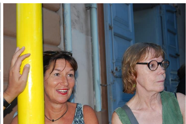
Mooi volk, in de corteo en langs de weg.